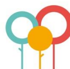
Zorg en aandacht voor de omgeving